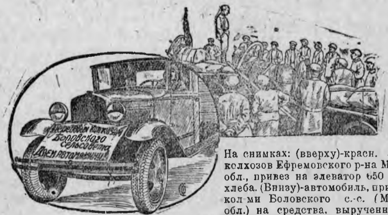
На снимках: (вверху)—красн. эбоз колхозов Ефремовского р-на Моск. обл., привез на элеватор 650 цент. хлеба. (Внизу)—автомобиль, приобретен колхозом Боловского с.-с. (Моск. обл.) на средства, вырученные от продажи хлеба кооперации.

Арбитр соревнования сельпо Ред. газ. „Коммунар“